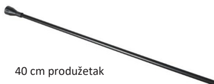
40 cm produžetak